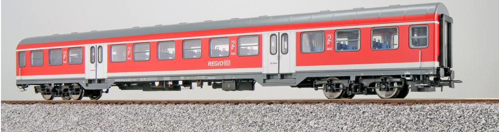
36515 , n-Wagen, H0, Bnrz 450.3, 22-35 932-9, 2. Kl, DB Ep. V/VI, verkehrsrot, DC