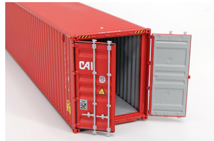
Container mit Innendetaillierung und zu öffnenden Türen