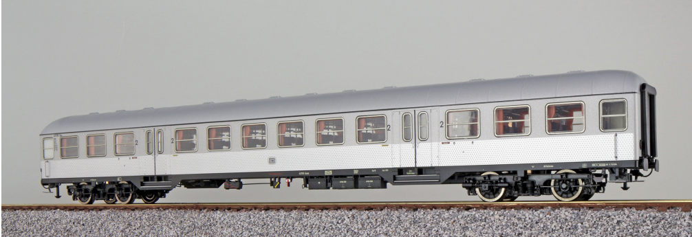
36519 , n-Wagen, H0, B4nb-59, 42727 Esn, 2. Kl, DB Ep. III, silber, DC