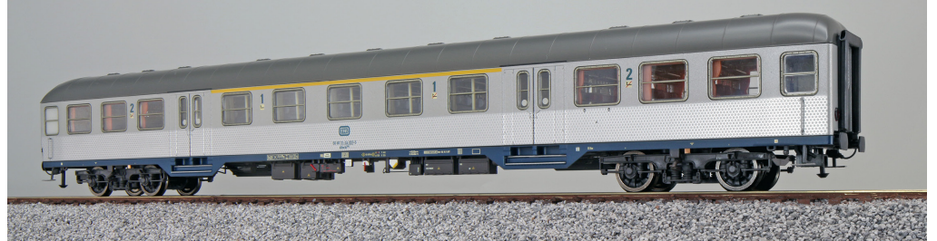
36485 , n-Wagen, H0, ABnrzb 704, 31-34 057-5, 1./2. Kl, DB Ep. IV, silber, DC