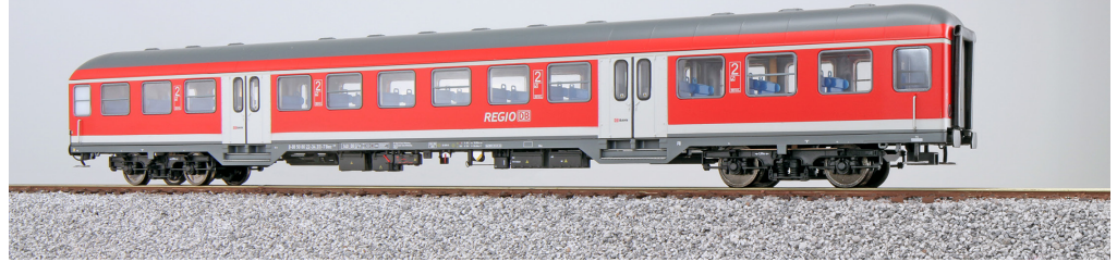
36514 , n-Wagen, H0, Bnrz 446, 22-34 311-7, 2. Kl, DB Ep. V/VI, verkehrsrot, DC