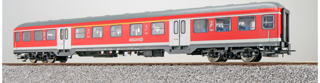
36516 , n-Wagen, H0, AB nrz 418.4, 31-34 264-7, 1./2. Kl, DB Ep. V/VI, verkehrsrot, DC