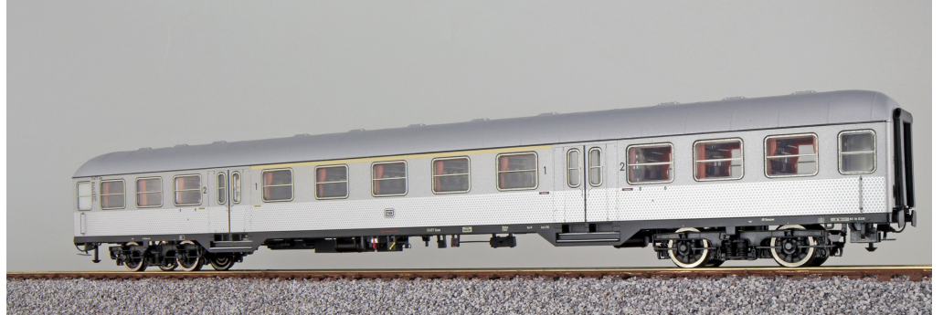
36487 , n-Wagen, H0, AB4nb-59, 31479 Esn, 1./2. Kl, DB Ep. III, silber, DC