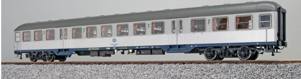
36484 , n-Wagen, H0, Bnrz 725, 22-34 078-2, 2. Kl, DB Ep. IV, silber, DC