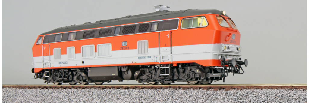
31014 , Diesellok, H0, 218 137 Citybahn DB, orange/weiss, Ep IV, Sound + Rauch, DC/AC