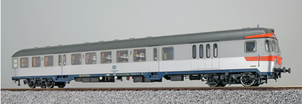
36486 , n-Wagen, H0, BDnrzf 740.2, 82-34 322-1, Steuerwagen, DB Ep. IV, silber, DC