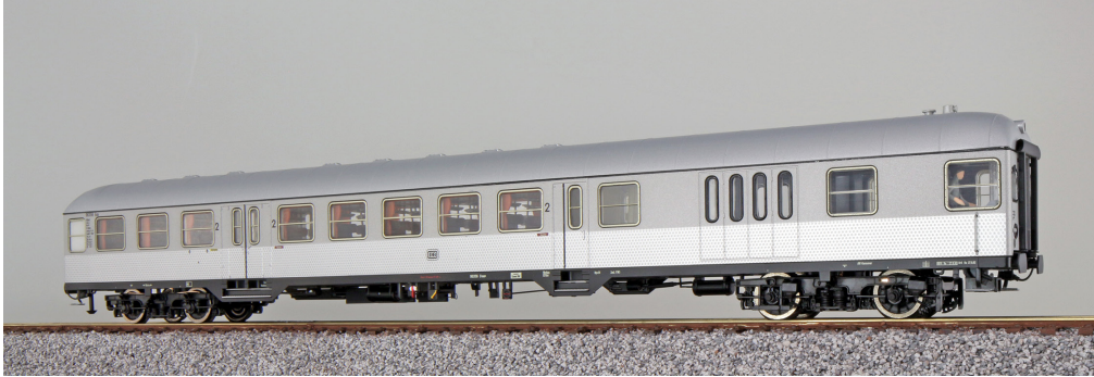
36488 , n-Wagen, H0, BD4nf-59, 96354 Esn, Steuerwagen, DB Ep. III, silber, DC