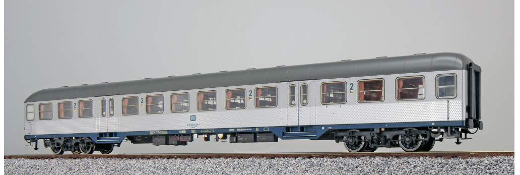
36483 , n-Wagen, H0, Bnrz 725, 22-34 106-1, 2. Kl, DB Ep. IV, silber, DC