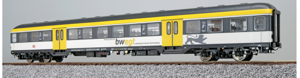
36510 , n-Wagen, H0, Bnrz 451.4, 22-34-112-9, 2. Kl, DB Ep. VI, lichtgrau/gelb/grau, DC