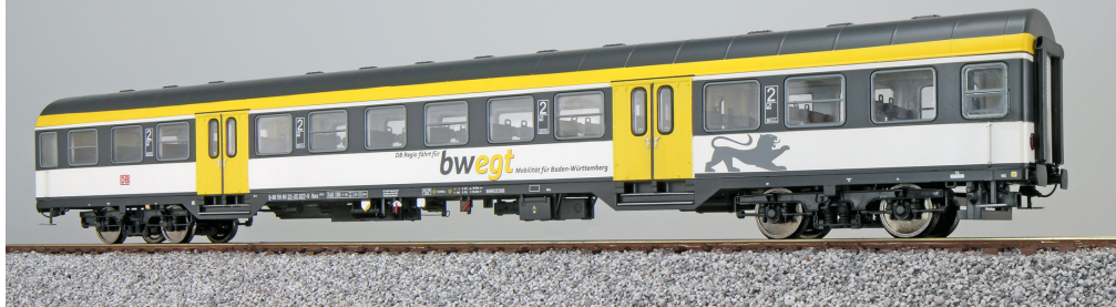
36511 , n-Wagen, H0, Bnrz 450.3, 22-35 927-9, 2. Kl, DB Ep. VI, lichtgrau/gelb/grau, DC