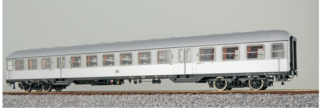
36518 , n-Wagen, H0, B4nb-59, 42725 Esn, 2. Kl, DB Ep. III, silber, DC