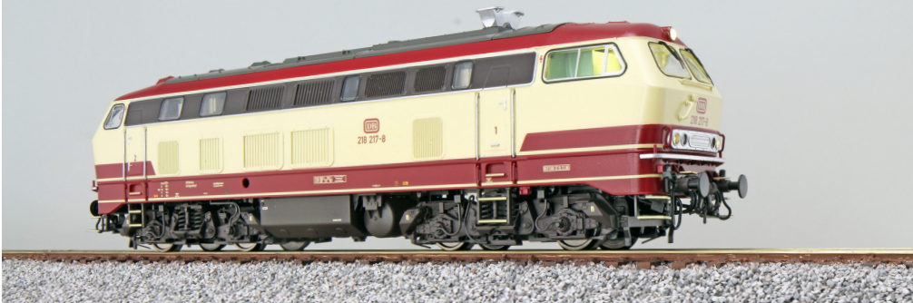
31015 , Diesellok, H0, 218 217 DB, TEE-Lackierung, Ep IV, Sound + Rauch, DC/AC