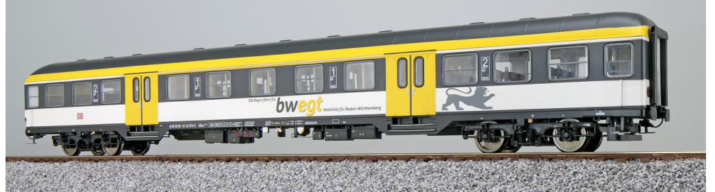
36512 , n-Wagen, H0, AB nrz 418.4, 31-34 074-0, 1./2. Kl, DB Ep. VI, lichtgrau/gelb/grau, DC