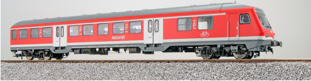
36517 , n-Wagen, H0, Bnrdfz 483.1, 80-35 193-7, Steuerwagen, DB Ep. V/VI, verkehrsrot, DC