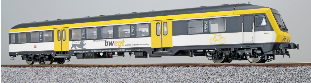
36513 , n-Wagen, H0, Bnrzdf 483.1, 80-35 188-7, Steuerwagen, DB Ep. VI, lichtgrau/gelb/grau, DC